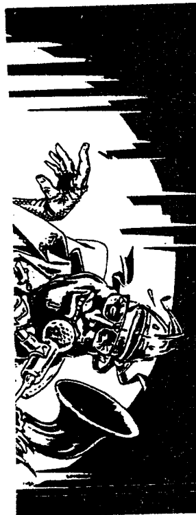
Blood in the streets

Wenig später, der Schlafsack und das Zelt waren verpackt, sein Feten - Set aus Zahnbürste, EBbesteck und - geschirr und etwas "gegen Unannehmlichkeiten", war zusammengestellt, brettete er mit seinem Kleinwagen den Autobahnzubringer in Richtung Umkirch und der Sonne. Unbedingt wollte er noch ein paar Spielchen wagen und das ein oder andere Bierchen beim Dangerhol - Abfeier - Service trinken bevor mit Anbruch der Dunkelheit die Show beginnen würde. Endlich gegen 18 Uhr erreichte er den Grillplatz "Baßgeige" in Oberbergen . Sein Erschrecken war uferlos: niemand, außer ein paar Spatzen und einem vollgefressenen Eichhörnchen war anwesend. Was zum Teufel war passiert? Die hastige Suche in seinem Kalender brachte ein schreckliches Erwachen: es war der 11.7.1993! Er war ein Jahr zu spät gekommen, außerdem war heute nicht Samstag - der Depp.