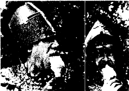
Bleibt immer cool, auch wenn 's um 's Lecken geht: J.W. Goethe, hier mit G. Berlichingen